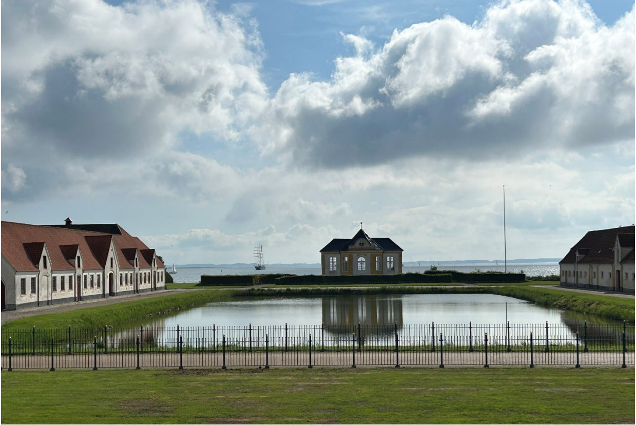
Den centrale barokhave