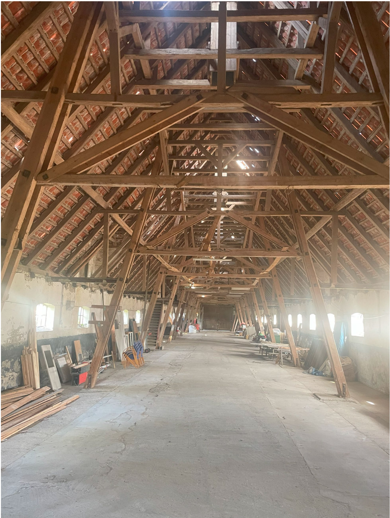
Interiør eksisterende avlsbygning