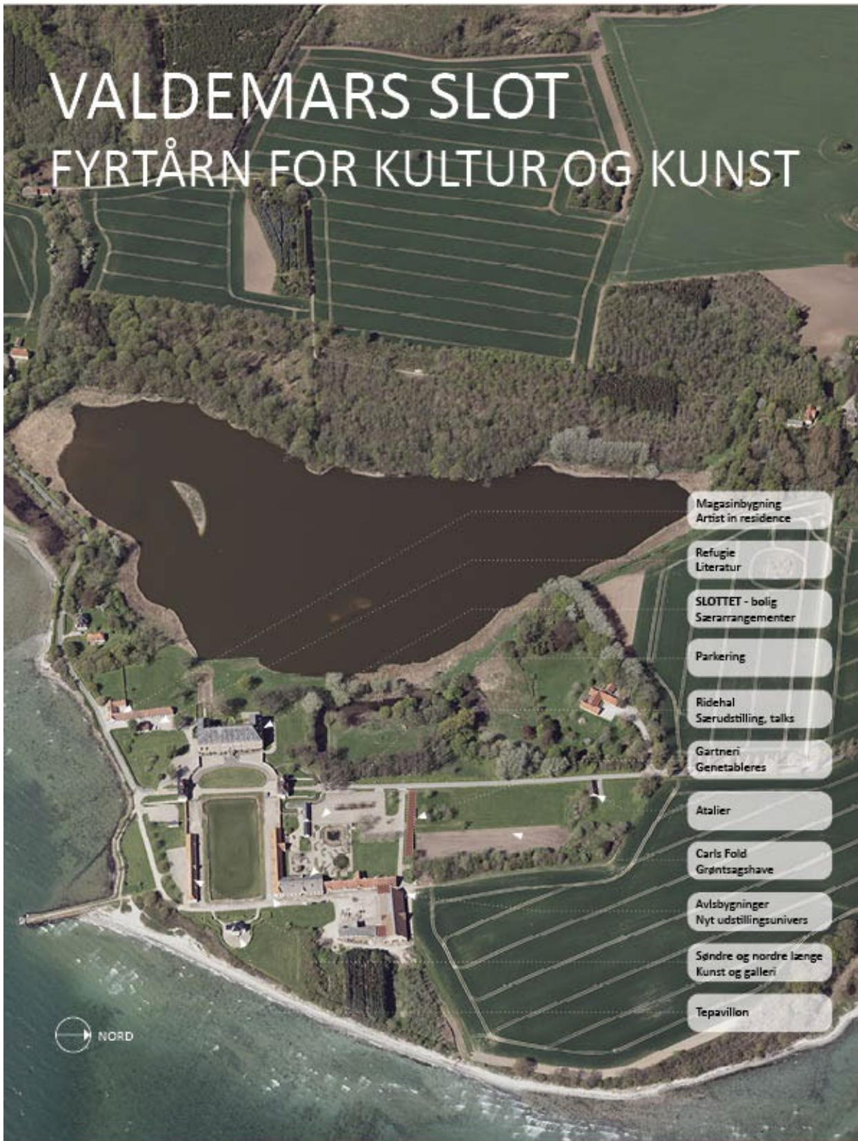
Plan med aktiviteter