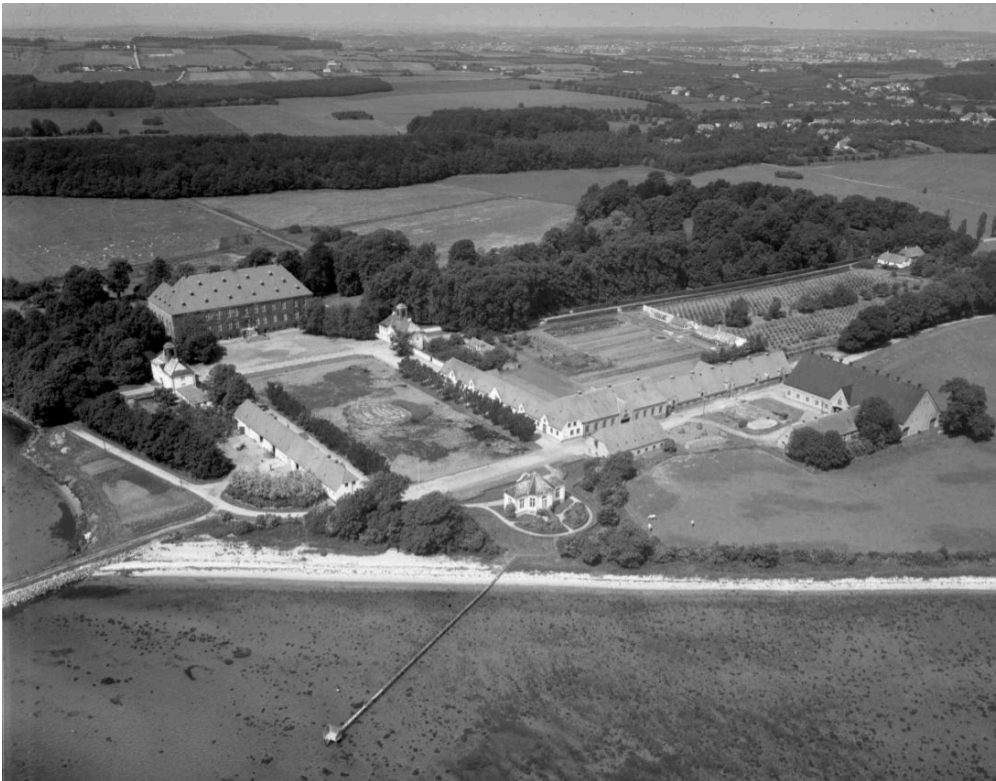
Luftfoto fra 1956 med Carls Fold gartneri